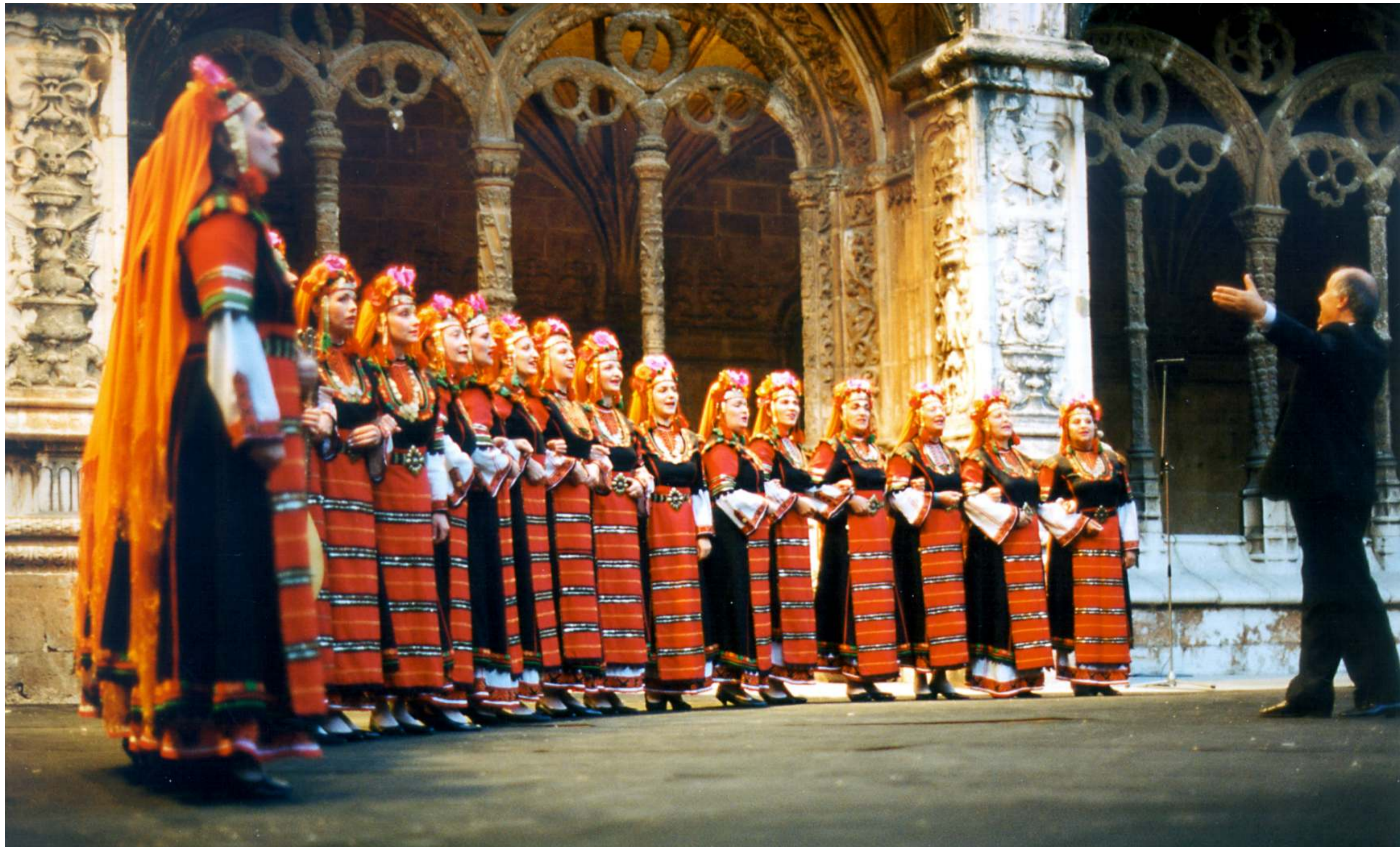
As Grandes Vozes Búlgaras, Zdravko Mihaylov