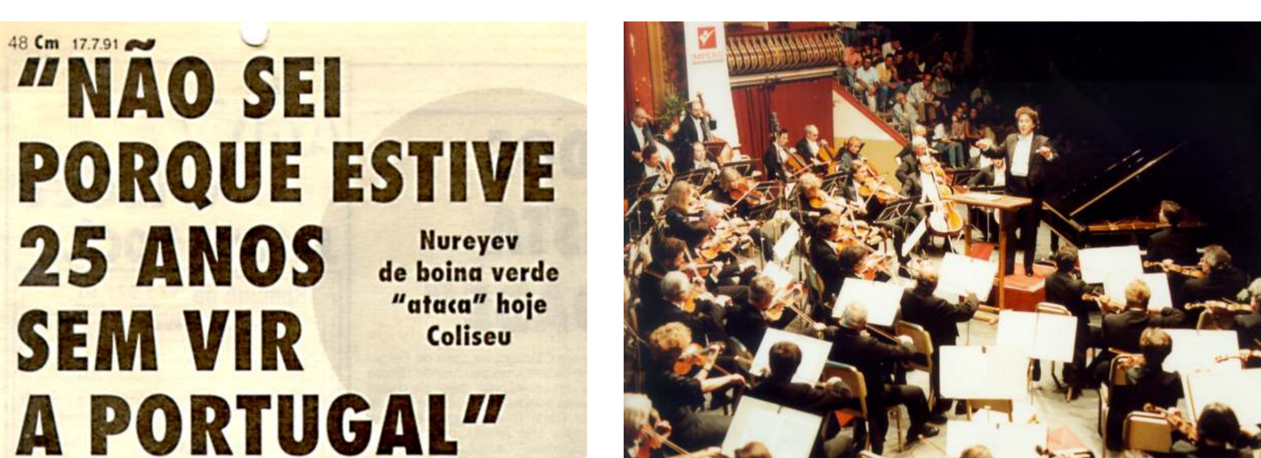
Orquestra Filarmónica de Moscovo, Vasily Sinaisky